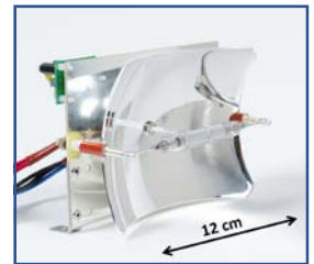
Flash UV : source compacte

2log à 5log de décontamination selon la nature du milieu et la puissance des flashes